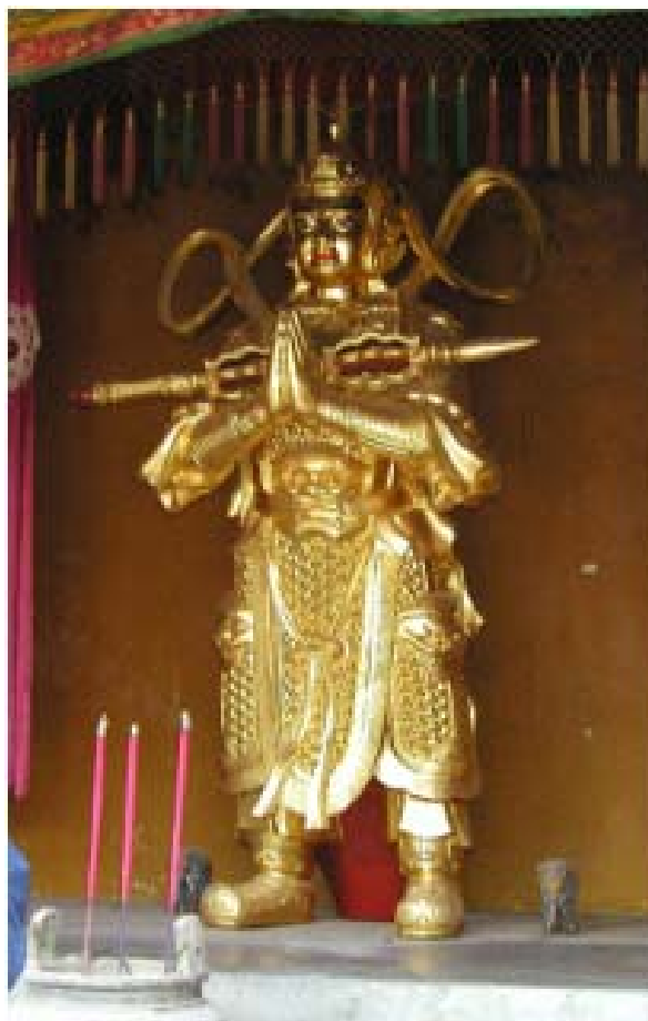
圖 2 峨嵋金頂的韋陀菩薩

在大陸佛寺導遊多半會介紹韋陀菩薩的聖相，以及佛門中和他有關的傳說習俗。一般寺院所造韋陀菩薩的身相和裝飾，多半像傳說中英武的天界將軍(如封神榜所常提到的樣子)，身著黃金鎧甲頭帶鳳翅盔，金光閃閃似乎在彰顯祂護持功德願力廣大，已經成就金剛不壞身。足穿烏雲皂履像是隱喻他疾赴佛門的危難。許多地方常將臉相作成童子相，主要是依附唐朝道宣律師傳述護