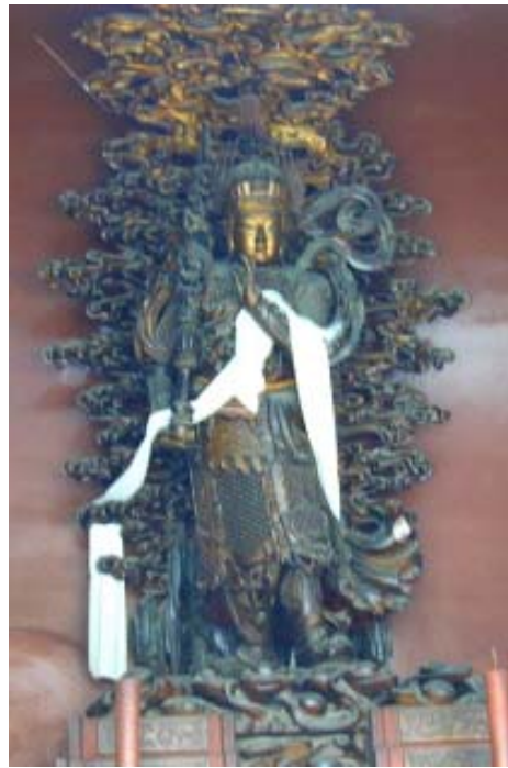
圖 3 雍和宮的韋陀菩薩

綜合幾次參訪時對韋陀菩薩聖相的印象，我個人感覺北京雍和宮所供奉的一尊(圖 3)，祂的氣勢威嚴俊拔、雕工精細裝飾巧妙最為特殊，是讓人一見難忘的聖相。北京近郊因為靠近皇城，寺院大多是皇族勒令修建，面相英挺氣勢威武似乎是這裡的共同特色(如戒台寺、潭柘寺等地)。很可惜的，潭柘寺原來供奉極有歷史法相又莊嚴的一尊聖相，這一趟發現已經重新新塑，新的塑像不如古代雕工的莊嚴，作法倉促令人遺憾。杭州古都，歷史悠久的淨慈寺、靈隱寺等地，可能也是經過皇族勒修的原因，聖相都類似北京的威嚴氣勢。靈隱寺有一個楹聯剛好可以形容這一類威嚴的聖相『如此娑婆世界仗著金剛一杵掃蕩群魔』『本來妙好威儀幻成珠飾雙纓莊嚴法相』。